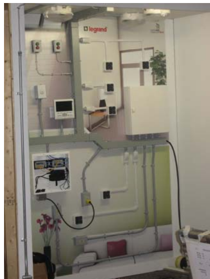
Teil seiner Arbeit an den WordSkills